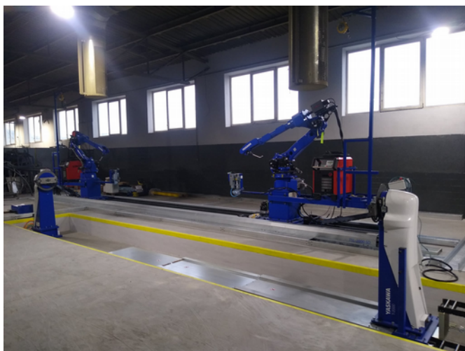
Robot spawający Yaskawa