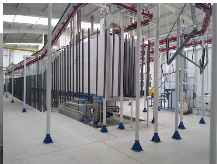
Lakiernia Expo-Drew Opoczno