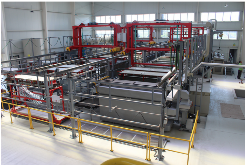
Cynkownia Opoczno - Expo-Drew